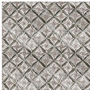
PIETRO Ficelle 09