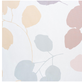
LIV AUTOMNE 205 Motif d'impression