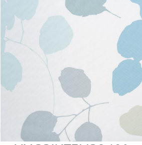
LIV PRINTEMPS 130