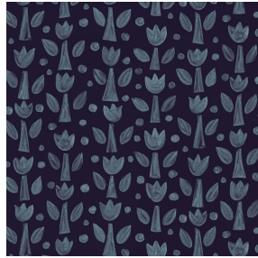
TULIPE Nuit 128 Motif d'impression