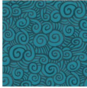
TUMULTE Orage 123