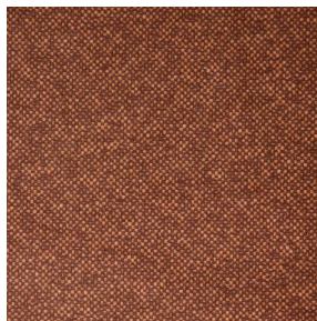
ANATOLE Chaudron 118