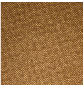
ANATOLE Or 94