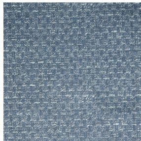
RUSTIC Bleu 41 Motif d'impression