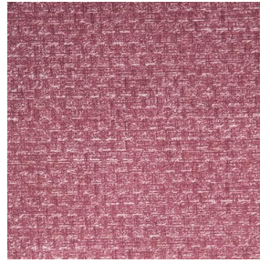
RUSTIC Hortensia 134