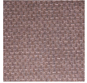
RUSTIC Terre 107