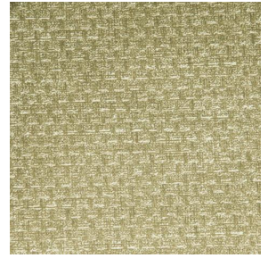
RUSTIC Bergamote 121