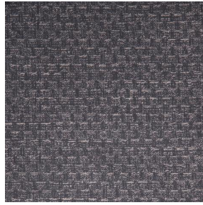
RUSTIC Titanium 98