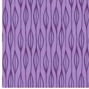
YENDI Lilas 19 Motif d'impression