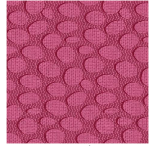
GALET Fuchsia 33