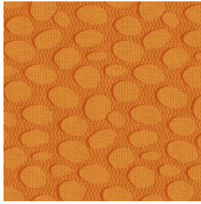
GALET Orange 15