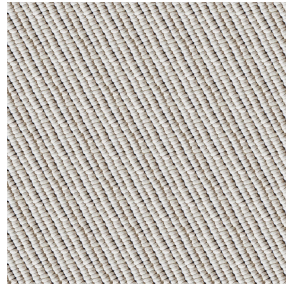
PIERRETTE Naturel 26 Motif d'impression