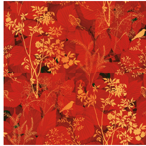
ODE Corail 14 Motif d'impression