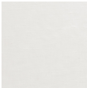
LY BPI 00 Support d'impression