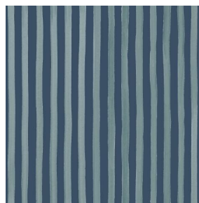
SONG Titanium 98