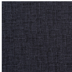
MURA NOIR 10 Motif d'impression