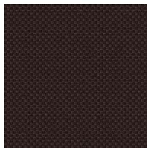
CHARLOTTE Ebene 124