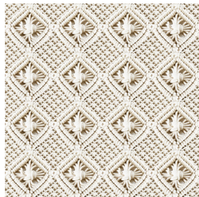
JOSETTE Naturel 26 Motif d'impression