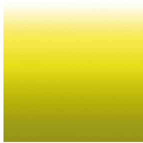
ZADIG Anis 62 Motif d'impression