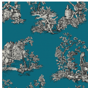
ZELIE Céladon 135 Motif d'impression