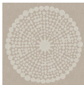
ANGELE Sable 67