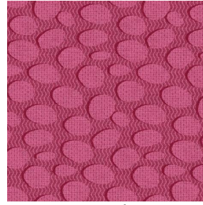
GALET Fuchsia 33