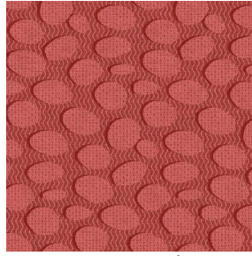
GALET Corail 14