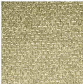
RUSTIC Bergamote 121 Motif d'impression