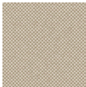
CHARLOTTE Beige 63