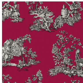
ZELIE Rubis 59 Motif d'impression