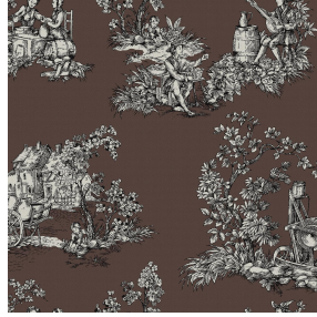
ZELIE Taupe 95 Motif d'impression