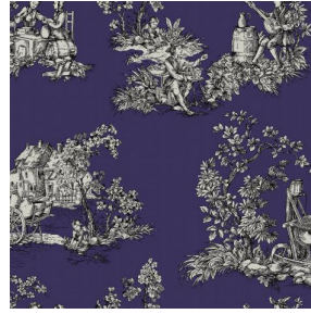
ZELIE Prune 84