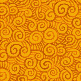
TUMULTE Safran 49