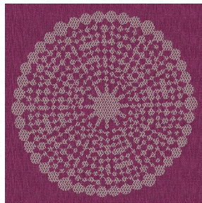
ANGELE Prune 84 Motif d'impression