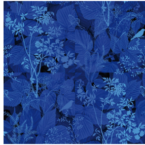
ODE Bleu 41 Motif d'impression