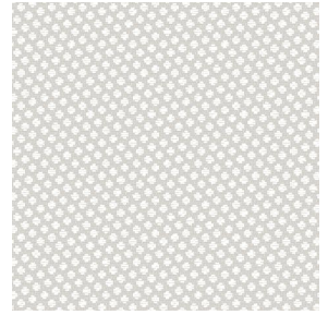
GONIDIE Perle 96