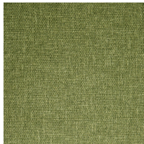
MUNA Olive 61 Motif d'impression