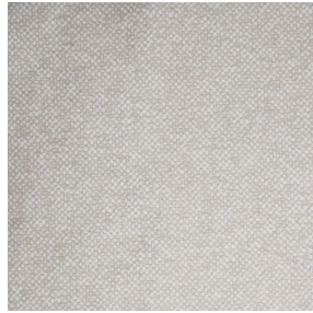
ANATOLE Naturel 26 Motif d'impression