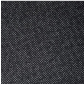
ANATOLE Titanium 98