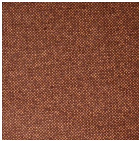
ANATOLE Chaudron 118