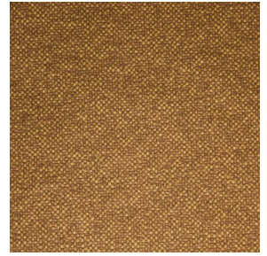
ANATOLE Or 94