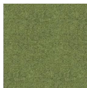
ELAINA Lierre 124