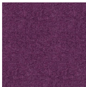
ELAINA Violine 105