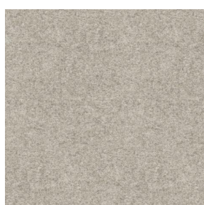
ELAINA Naturel 26