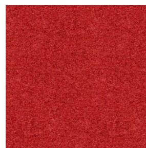
ELAINA Rouge 21