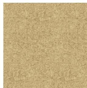
ELAINA Beige 63