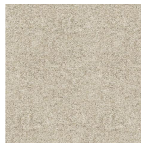
ELAINA Lin 11