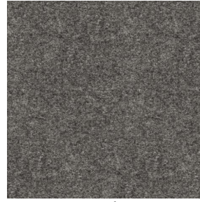
ELAINA Anthracite 38