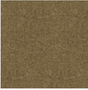
ELAINA Chamois 111