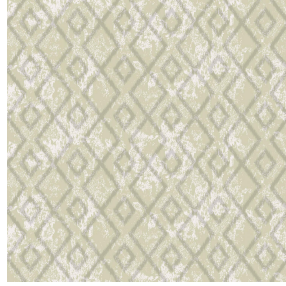
6021 Beige 63 Motif d'impression