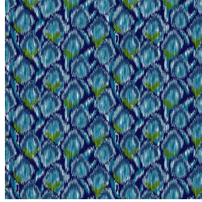
MANDU Bleu 41 Motif d'impression