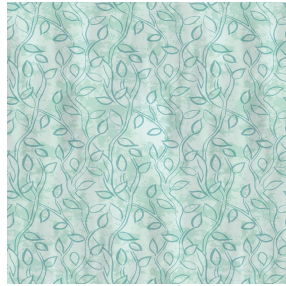
6053 Céladon 135 Motif d'impression