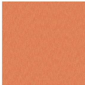
CALI Orange 15 Motif d'impression