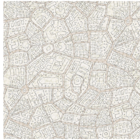
6016 Naturel 26 Motif d'impression