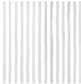
SONG Naturel 26