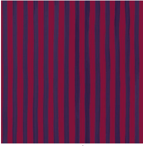
SONG Opéra 104