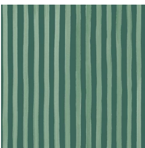
SONG Sapin 126