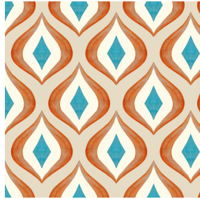
WILLY Multico 98 Motif d'impression