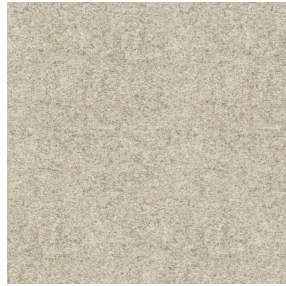
ELAINA Lin 11 Motif d'impression