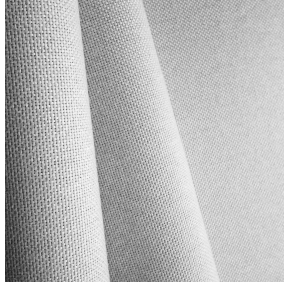
NOCTANE BPI 00 Support d'impression