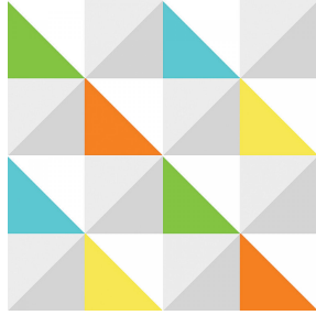
VICTORIEN multico 98 Motif d'impression