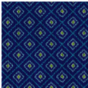
HAMPI Bleu 41 Motif d'impression