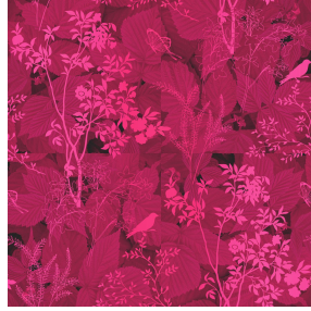
ODE Fuchsia 33 Motif d'impression