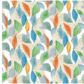
AQUARELLE Multico 98 Motif d'impression