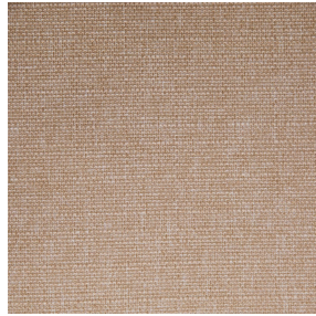
MUNA Saumon 143 Motif d'impression