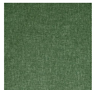
MUNA Lierre 124