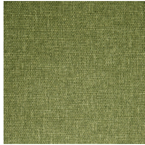
MUNA Olive 61 Motif d'impression