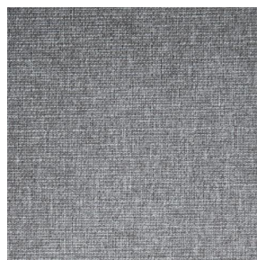
MUNA Sisal 140