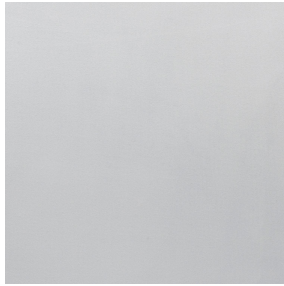
NOCTWIN BPI 00 Support d'impression