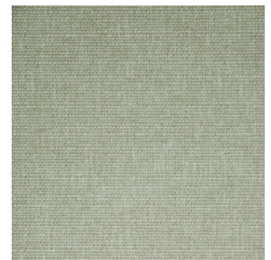
MUNA Sable 67