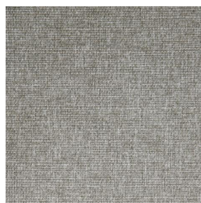
MUNA Chanvre 72