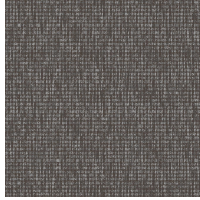
FLOT Taupe 95 Motif d'impression