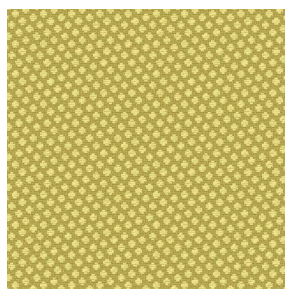
GONIDIE Bergamote 121