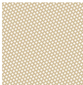
GONIDIE Crème 32