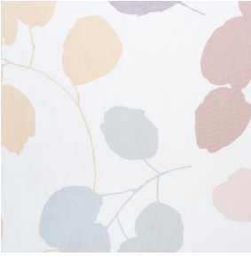
LIV AUTOMNE 205