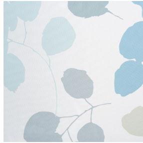
LIV PRINTEMPS 130 Motif d'impression