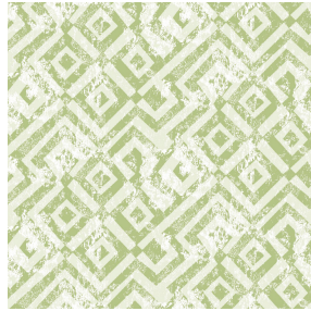
6040 Vert 24 Motif d'impression